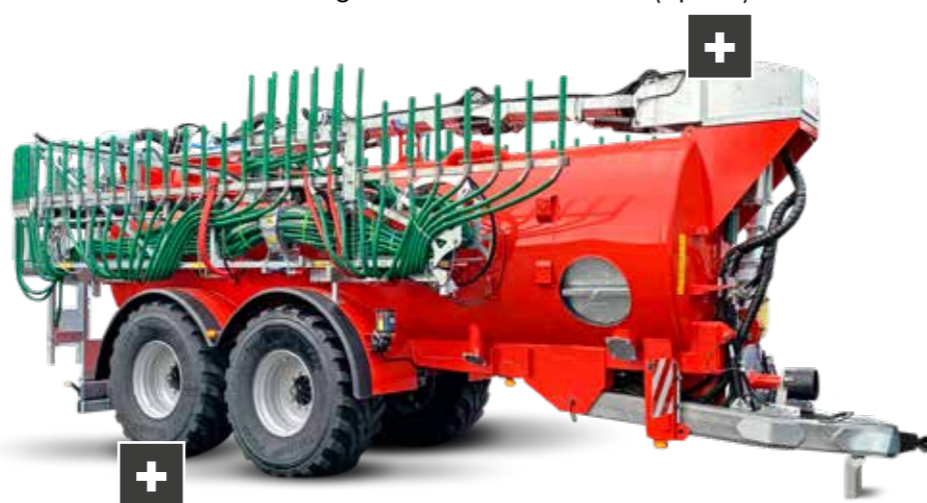
Unterschiedliche Achsaggregate (Option) Different axle assemblies (option)