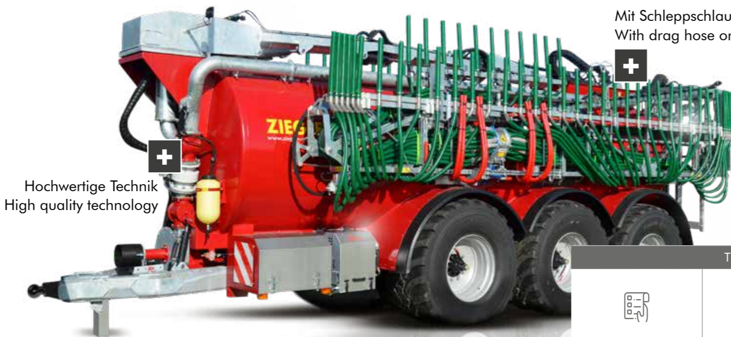
Hochwertige Technik High quality technology

Die FARMER-LINE-Gülle-fässer sind eine kostengünstige Alternative zur PROFI-LINE und schon als Einachser mit 10m 3 Fassungsvermögen erhältlich.